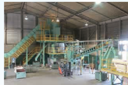
家電部品一括破碎選別ライン