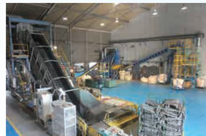
熱交換器破碎選別ライン