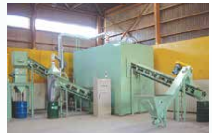
使用済み乾電池処理設備外観